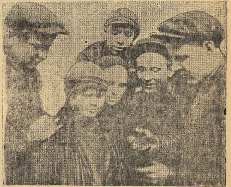
Ударная комсомольская бригада паровозного цеха — тормоз Вестингауза за хорошую подготовку к обмену первой получает новый комсомольский билет.

Комсомольская организация должна учесть недостатки в работе этих ячеек, чтобы не повторить их в проведении вторых собраний о получении комсомольского билета.